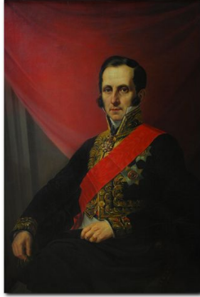
Сергей Семенович Уваров

Путь этой мечты пересекается с путем "ретро-перспективной" утопии "русскости" (или "славянства"). Она также ведет либо в сказку, либо в универсалистский мир объединенного человечества. Новшества Тревоги могли служить основой первого пути. Второй порожден прежде всего масонской мечтой: одна из задач братства — найти утерянное знание первых людей и первоязык, "язык адамический", хранилище тайн творения. Лингвистический поиск может сравниться с поисками рая, золотого века.