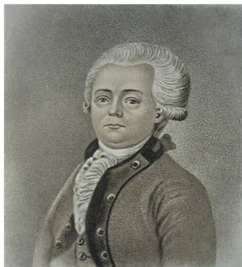
М. Д. ЧУЛКОВ

Этот золотой век появляется в сочинениях, которые используют народный фольклор по большей части западных губерний для искусственного конструирования славянской мифологии по греко-римской модели и разрабатывают новые формы повествования, напоминающие одновременно Сказки тысячи и одной ночи, рыцарский и приключенческий романы.