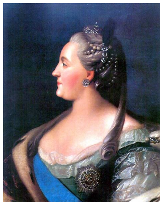
императрица Екатерина 2

Корни этого явления уходят в 18 и 19 века.