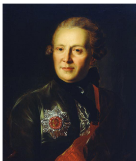
Александр Петрович Сумароков.

Черты классической утопии (в Славенске запрещена смертная казнь, нет бедняков, развивается горная промышленность, работают современные фабрики [Попов, I, 2 — 4]) растворены в сказочной атмосфере, окутывающей эти повествования.