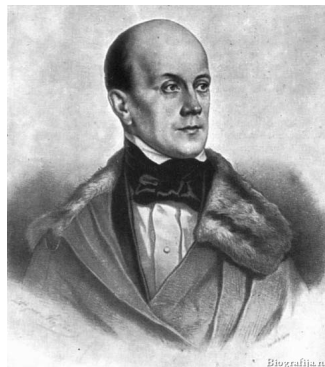
Пётр Яковлевич Чаадаев

После восстания декабристов между властями и частью культурной элиты России происходит разрыв. Русская интеллигенция с тех пор видит себя в оппозиции к государству. Между установившимся порядком и его противниками начинается более или менее открытая вражда, в которой народ играет роль ставки и заложника. В этом контексте разгорается спор, повлиявший на всю русскую общественную мысль, спор между «славянофилами», защитниками русской самобытности и «западниками», сторонниками единства исторического и культурного процесса.