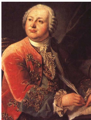
Михаил Васильевич Ломоносов

Императрица предписывает И. Болтину написать опровержение "Истории древней и новой России" француза Леклерка (1782). В своем пояснительном и хвалебном очерке географии, нравов, социального строя и истории России Болтин, наряду со Щербатовым, закладывает основу для всех будущих размышлений о традиции, "славянскости" и "русскости"