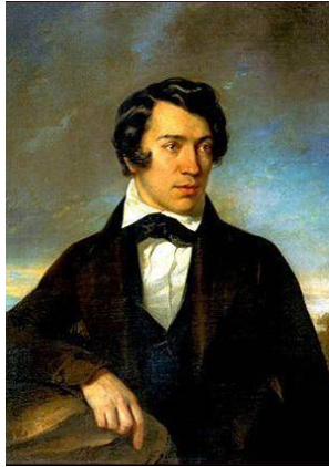
Алексей Степанович Хомяков

Кроме государственного гнева, выпад Чаадаева спровоцировал мгновенную реакцию славянофилов (еще одно ироническое прозвище, принятое теми, против кого оно было направлено).