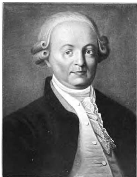
Тредиаковский Василий Кириллович.

Не следует недооценивать значения другого «ретро-перспективного» аспекта исторических споров, который раскрывается в текстах 1760-х годов двух великих представителей классицизма — Тредиаковского и Сумарокова. В ответ на норманнскую теорию они хотели показать, что славянский язык и русская нация принадлежат к древнейшим в Европе.