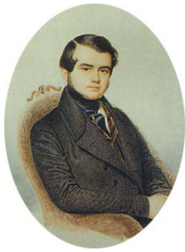
Владимир Александрович Соллогуб

В рассказе Ф. Соллогуба (1813–1882) "Тарантас" (1845) герой мечтает о воплощении славянофильской утопии.