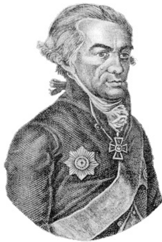
Херасков Михаил Матвеевич

Бывает, что писатель, вдохновляясь пророческой традицией, смотрит на историю из ее начальной точки, чтобы «увидеть» грядущее. Во "Владимириаде", мистической поэме Хераскова (1785), первый русский князь-христианин прозревает после своего обращения бурную судьбу России вплоть до счастливых дней царствования Екатерины.